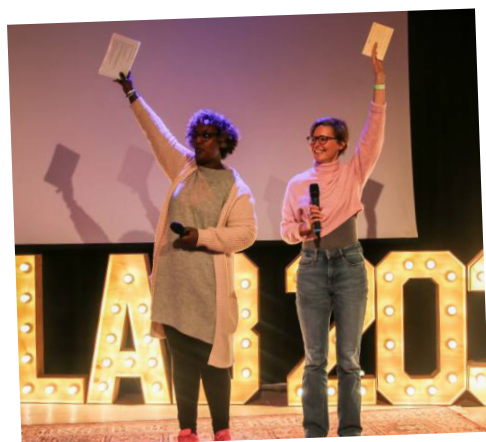
Lab 2030 #4 festival