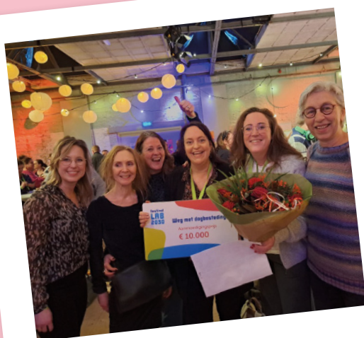
Een van de twee prijswinnaars Amarant

In januari vond het Festival Lab 2030 plaats over 'Weg met traditionele dagbesteding'. De bijeenkomst was de afsluiting van het Lab 2030 waarin twintig teams aan de slag zijn gegaan met het vernieuwen van dagbesteding. Zij deelden hun bevindingen en het programma bood inspiratie voor anderen om ook aan de slag te gaan met vernieuwing.