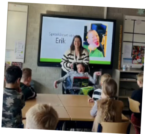
Amarant prijswinnaar in actie